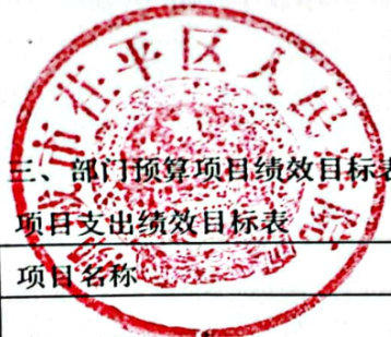
三、部门预算项目绩效目标表 项目支出绩效目标表