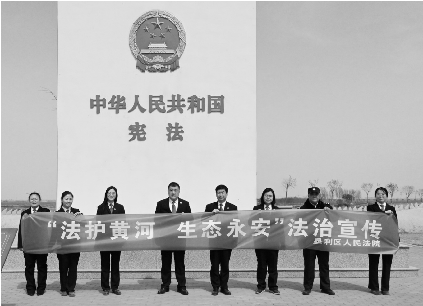
东营市垦利区人民法院推动黄河口地区生态保护和高质量发展，对涉黄河口国家公园创建、管理及自然保护区环境资源、生态保护的案件实行刑事、民事、行政“三合一”归口审理，建立污染防治、生态损害赔偿磋商、多元修复和执行回访机制，在审判能力、生态修复、部门协同、法治宣传上持续发力，着力打造“守河望海·法护黄蓝”环黄审判品牌，推动黄河口地区生态环境持续改善，服务保障黄河重大国家战略实施。图为黄河保护普法宣传现场。

“张法官，您可帮我大忙了，我这个案件已经在执行阶段了，心里的大石头总算落地了，您看什么时间方便，咱出来聚聚？”从收到判决书后，这已经是这位当事人打来的