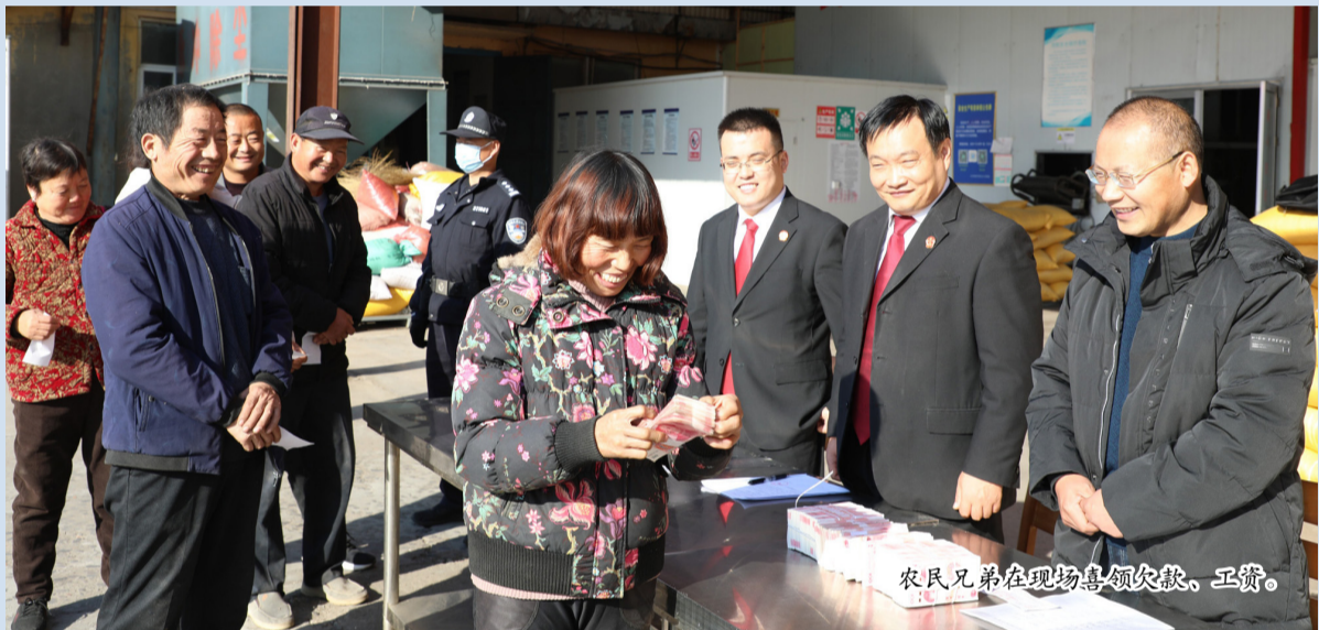
农民兄弟在现场领取欠款、工资。