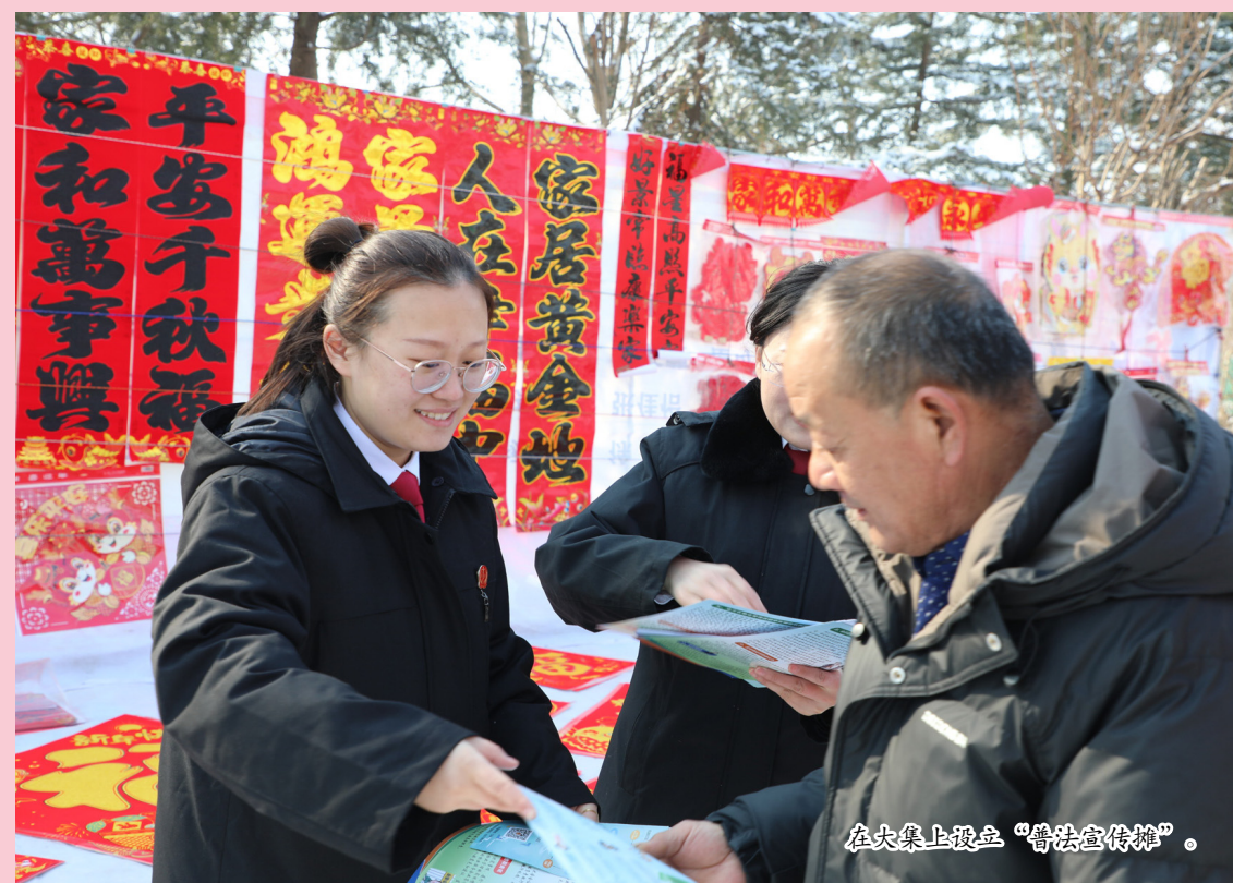
在大集上设立“普法宣传摊”。