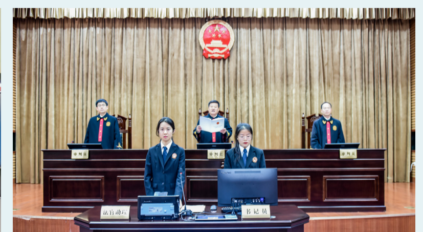
▲ 2024年1月8日，青岛海事法院公开开庭船舶碰撞引发的重大责任事故案，被告“义海”轮船长获刑。