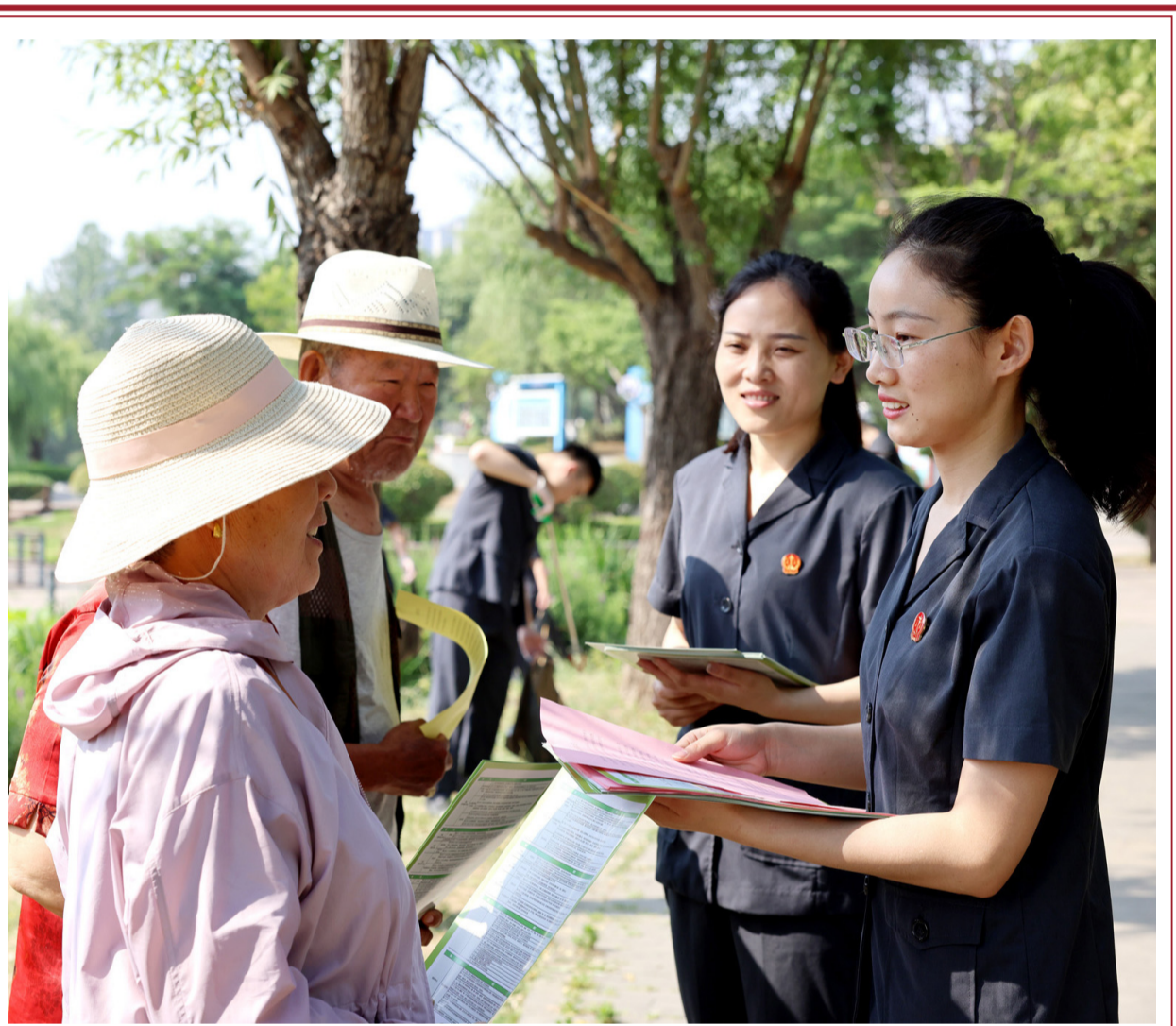
为做好六五环境日普法宣传工作，近日，枣庄市中区人民法院组织法官志愿者到当地西沙河沿岸、河道清理垃圾杂物，并向市民宣传环境保护法律法规知识。图为法官在科普法律知识。