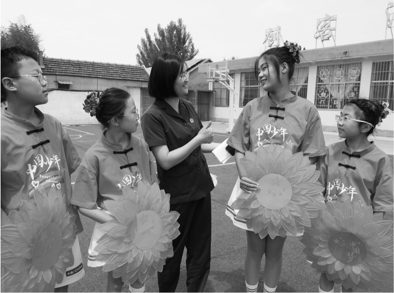
近日，莒南县人民法院干警走进板泉镇中心学校，开展“情系留守儿童，法护幼苗成长”主题活动，为全校师生送去反校园欺凌、防诈骗等法治宣传。因为法官正在解答学生提出的问题。