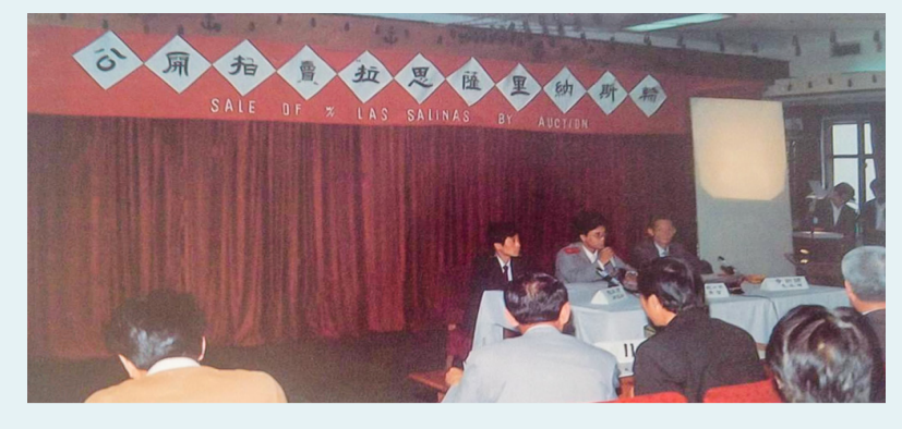
▲ 1988年6月9日，拍卖“拉思·萨里纳斯”轮。该案是《最高人民法院关于强制变卖被扣押船舶清偿债务的具体规定》出台后的全国首例拍卖(变卖)船舶案。

习近平总书记在2024年5月视察山东时强调: “要发挥海洋资源丰富的得天独厚优势，经略海洋、向海图强，打造世界级海洋港口群，打造现代海洋经济发展高地。”百川争流，奋楫争先。四十年是一个里程碑，也是一个新起点。站在新的历史开端，青岛海事法院将以更坚定的信念、更饱满的热情、更务实的作风，为海洋强国、海洋强省建设提供更加有力的法治保障。浩渺行无极，扬帆但信风!