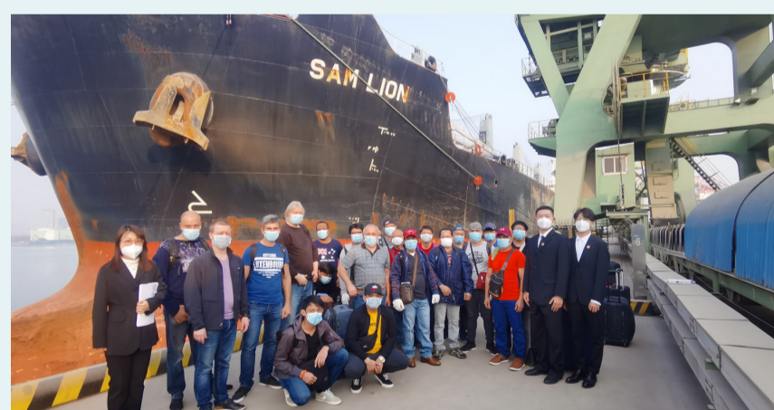
▲ 2020年，对利比里亚籍“狮子”轮案中21名外籍船员积极展开人道主义援助。