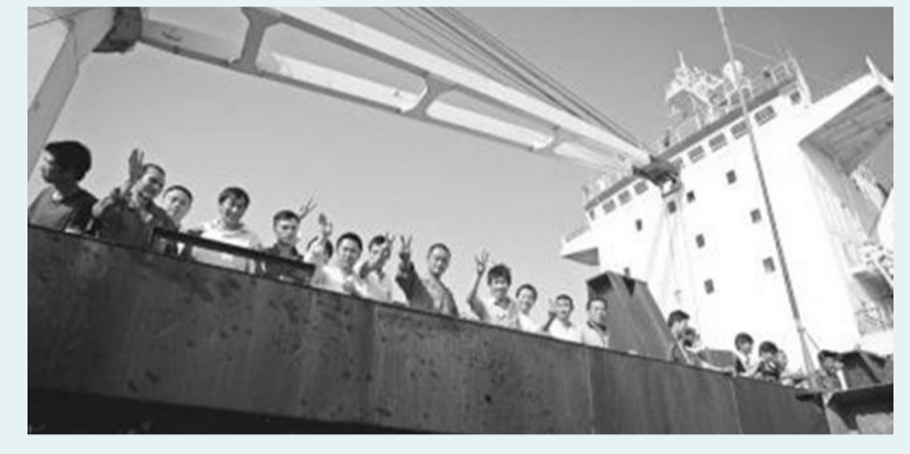
▲ 1999年11月，成功解救被困152天的圣文森特籍“大安吉”轮及28名中国船员。