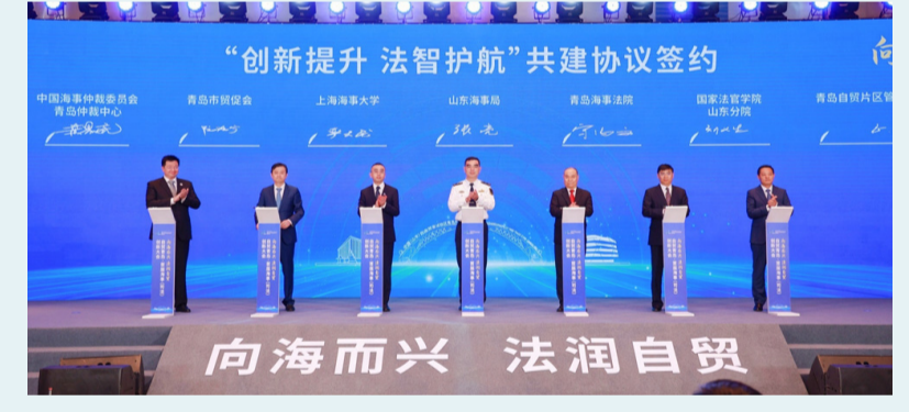
▲ 2023年10月12日，首届海事(司法)创新大会在青岛自贸片区举行。