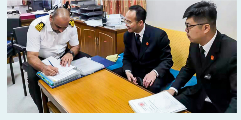
▲ 2019年3月11日，在“尼莉莎”轮案中适用“活扣押”，促使当事人达成和解，外国船东将船舶更名为“尊重”，向中国法治致敬。